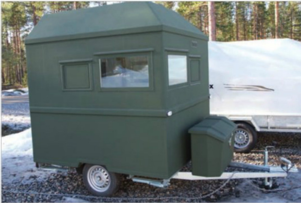
Sovellus taukovaunusta. Metsästyskopiksi varusteltu vaunu on keskikokoinen perustaukovaunu, joka on varusteltu tarkoitukseen sopivilla avattavilla luukuilla. Maalaus on tehty armeijan häivemaalilla.