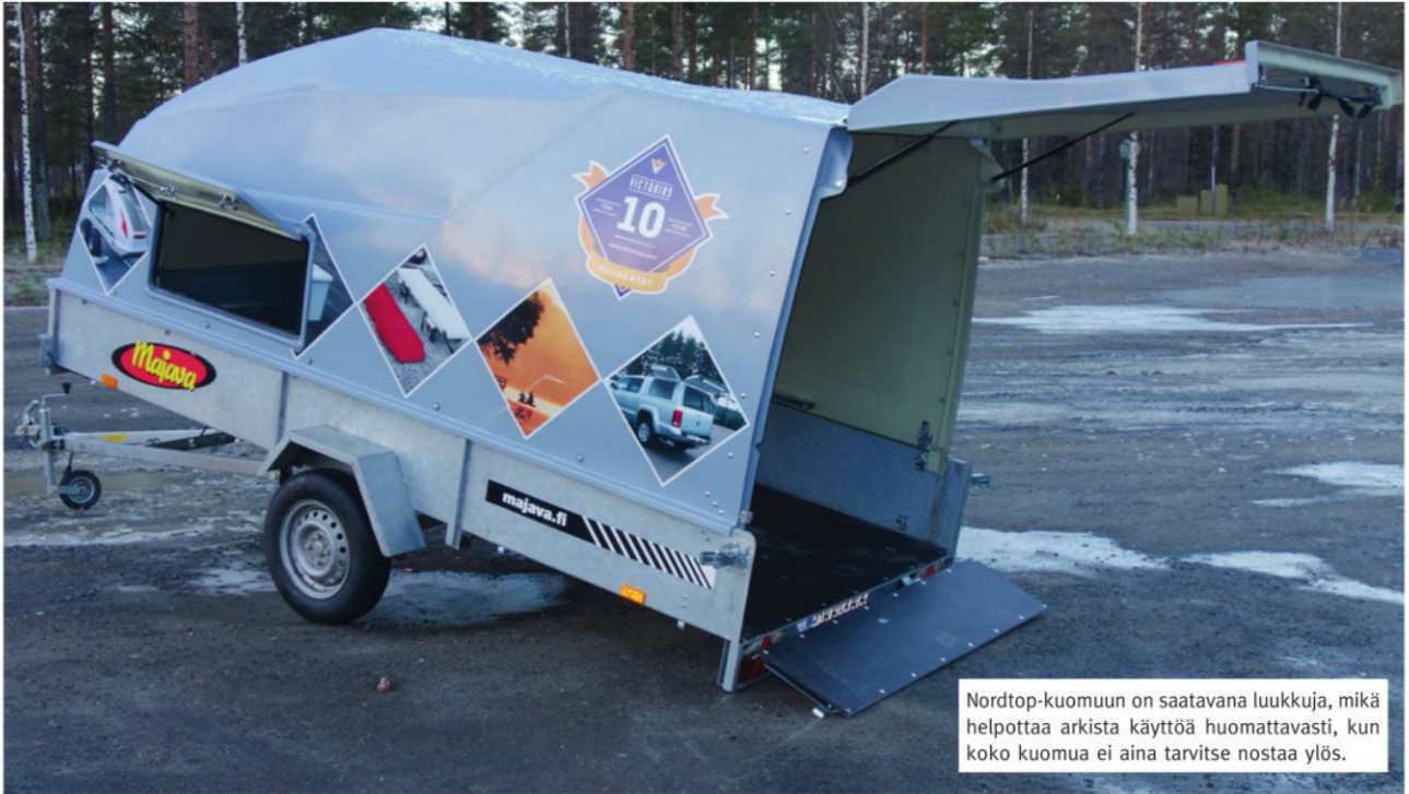
Nordtop-kuomuun on saatavana luukkuja, mikä helpottaa arkista käyttöä huomattavasti, kun koko kuomua ei aina tarvitse nostaa ylös.