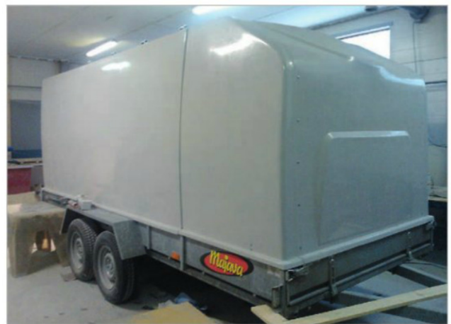
Tämän kevään uutuustuote Victoriuksella on Nordtop MD -sarja. Se käsittää kuomut lavettivaunuihin.

Victoriusen Nordtop-kuomumallisto kattaa ammattilaisten monipuoliset ja monesti erilaiset tarpeet. Perinteistä kuomuratkaisua Victoriuksella on kehitetty lisäämällä kuomuun luukkuja. Näin käytettävyys helpottuu ja paranee huomattavasti, kun joka kerta ei tarvitse nostaa koko kuomua ylös. Jotkut ovat huomanneet, että kuomu toimii parhaiten kokonaan il-