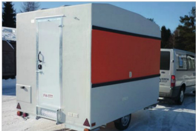
Eristetyt taukovaunut ovat erittäin kestäviä ja mahdolliset kolhut on helppo korjata. Siksi ne ovat suosittuimpia työkäytössä kuin asuntovaunut, mutta myös verotus ohjaa taukovaunujen suuntaan.

tai mainospaikkaksi. Victorious antaa kuomuilleen kymmenen vuoden materiaalitakuun.